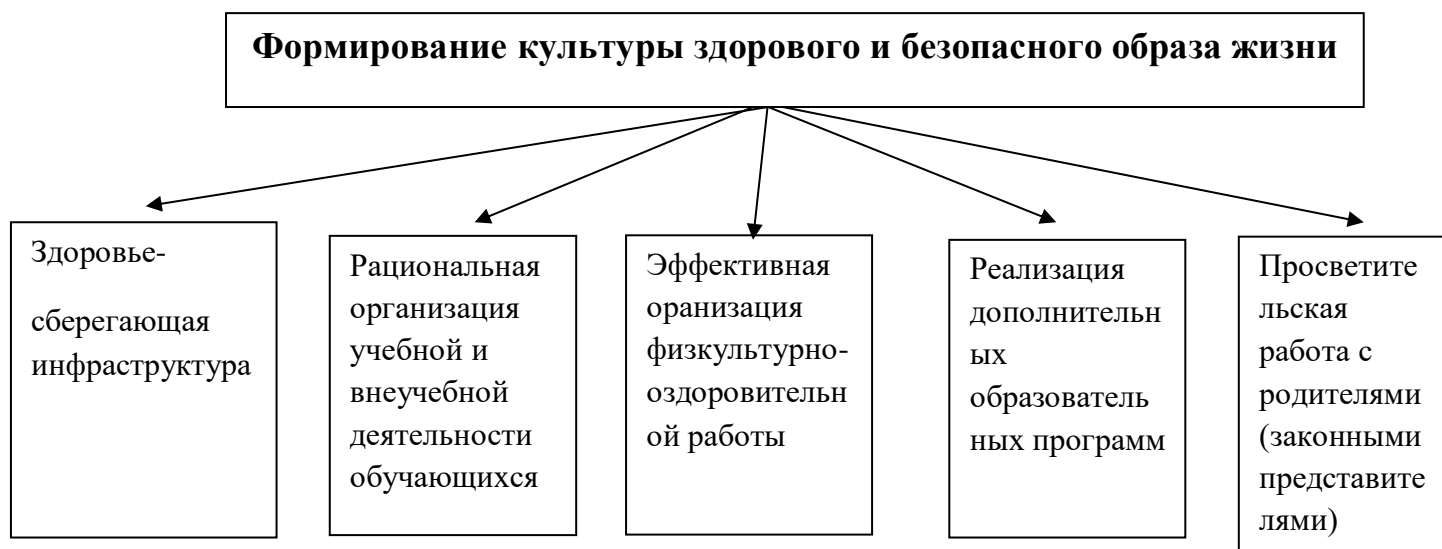
Рисунок 2 – Структура системной работы по формированию культуры здорового и безопасного образа жизни

Структура системной работы МБОУ «Каспийская гимназия №11» представлена на рисунке 2 в виде пяти блоков, содержательное наполнение которых представлено ниже.